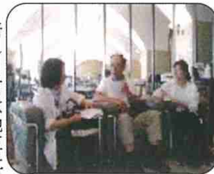
宮本新会長にインタビュー