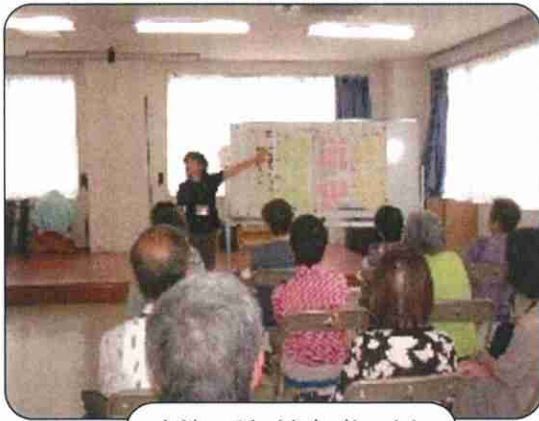
血液の話 (参加者35名)

血流をよくするために 第二の心臓といわれて いるふくらはぎの運動 (かかと上げ運動)が有 効だそうです。 これからの季節は血流 が悪くなり、血圧が高 くなると脳血管障害や 心筋梗塞を引き起こし やすくなります。 今から汗をかける体 を作っておくことが 大切です。 桜台倶楽部の皆さん は定期的に集まって 筋トレ体操(筋・金・ 近トレ)を楽しみなが ら健康維持に努めて いるそうです。 最後にメンバーの皆 さんで筋トレ体操を 披露してくれました。