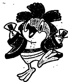
上総いちはら国府祭りのマスコットキャラクター「オツサくん」