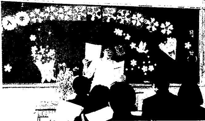
はじめての学級活動

心を笑顔にし、友達を呼び寄せ、周りのみんなを幸せにする、そんな「みんなが優しさでつながる有秋中」を目指そうと熱く生徒たちに語りかけました。地域の宝である子どもたちを、引き続き地域全体で育てていけるよう、ご理解とご協力をよろしくお願いたします。