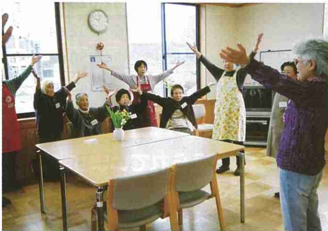
地域の高齢者に憩いの場を提供するなど、赤十字では 地元に着目した活動も行っています。