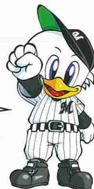
マーくん