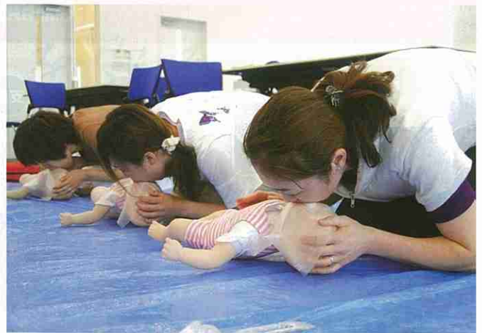
いのちを救う方法や、健康で安全に暮らす知識と技術を普及しています。