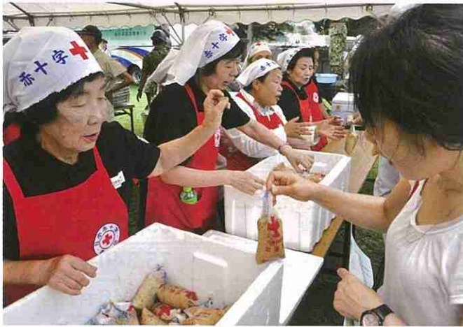
もしも災害が起きた時、被災者へ温かい食事を届けます。