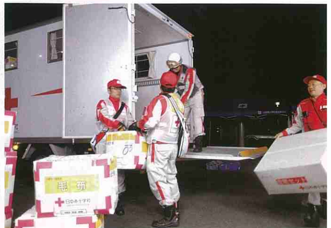
災害時に救援物資を迅速に届けられる体制をつくっています。