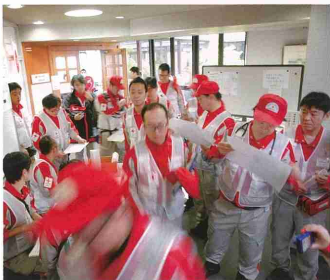
平成28年 熊本地震災害(全国から集まった救護班)

日本赤十字社は、常に社会のあらゆるシーンに目を向け、救いを必要とする人々のために 人道的支援活動を展開しています。