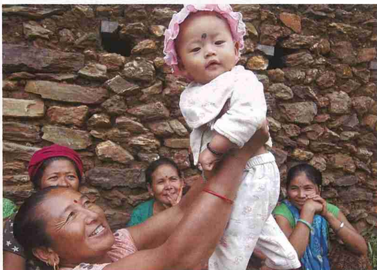
ネパール赤十字社支援事業

日本赤十字社が実施する国内の災害救護活動、 救急法などの講習普及事業、青少年赤十字活動、 国際救援活動など様々な活動は、国や県などの補助金に よらず、赤十字の活動にご賛同いただいた皆様からの 活動資金によって実施されています。