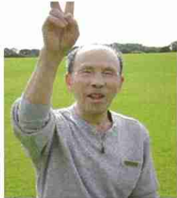
年男年女最年長です!