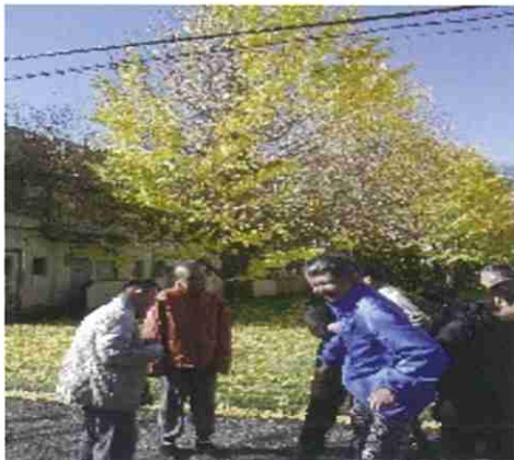
↑ 普段の日中活動の様子です。基礎2科より