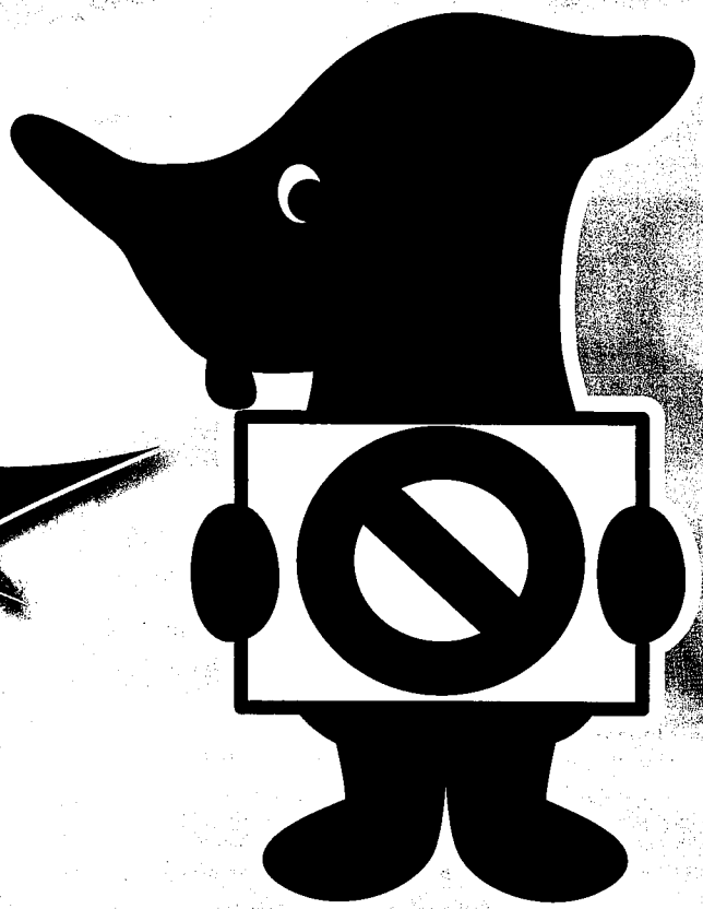
千葉県マスコットキャラクター「チーバくん」