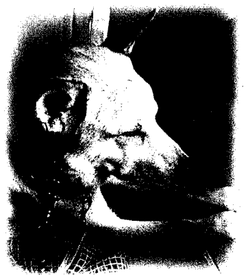
四街道市 ベベくん