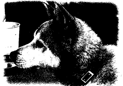
銚子市 サブロウくん