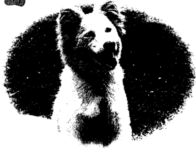
富里市 こはるくん