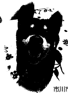
市川市 シンバくん