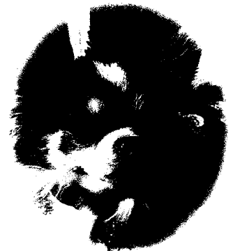
千葉市 チョコちゃん