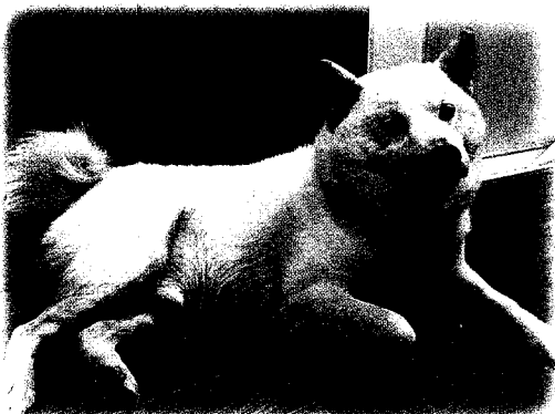
市川市 モンテくん