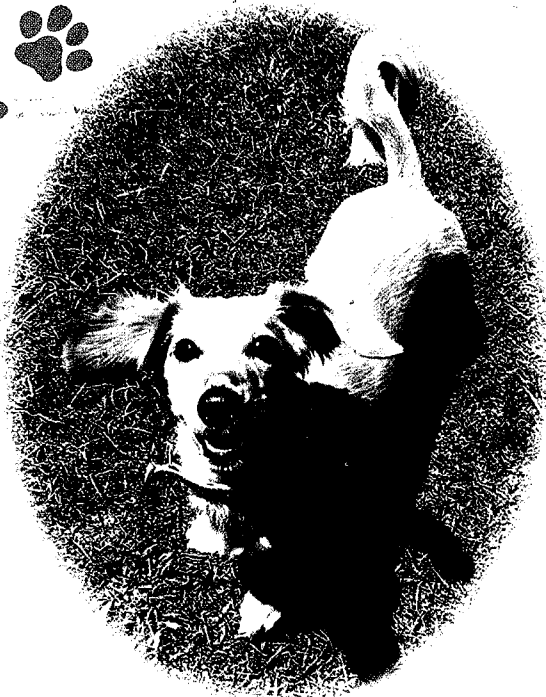
いすみ市 きなちゃん