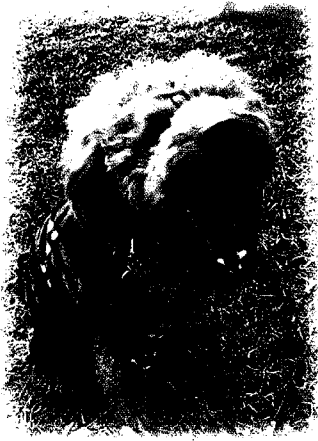
市原市 アメリちゃん