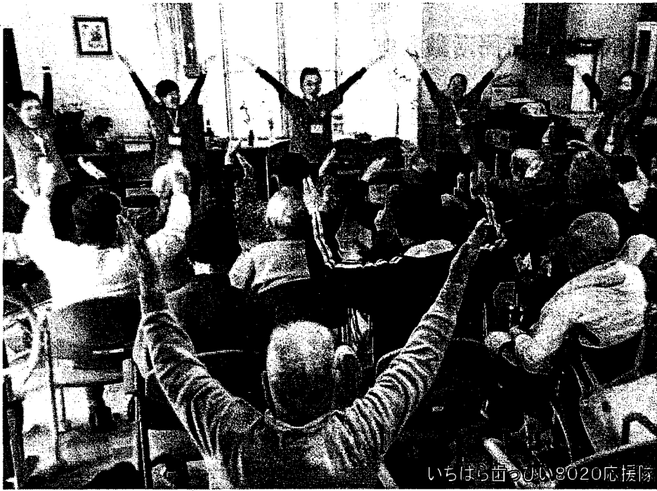
いちばら苗うい9020応援隊