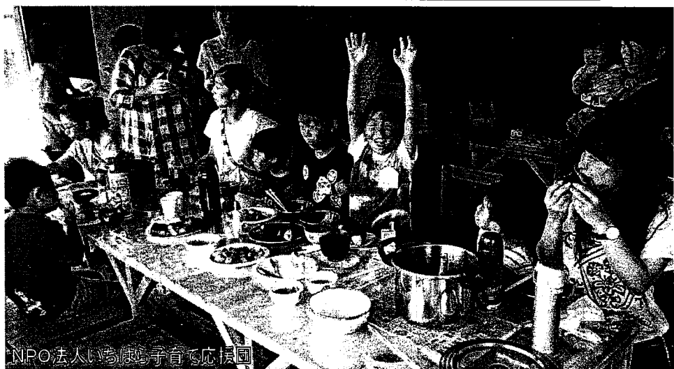
NPO法人いちばら子育て応援団