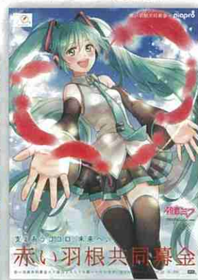
平成28年度 初音ミクポスター

Illustration by さきっこ ©Crypton Future Media, INC. www.piapro.net piapro