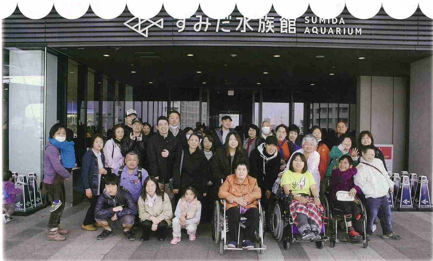
バスで遠方まで外出ができ、水族館でみんなと楽しい思い出を作りました。(障がい者ふれあい交流事業/東金市社会福祉協議会)

平成27年度の共同募金に6億9392万円のご協力をいただきありがとうございました。