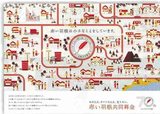
平成28年度 赤い羽根共同募金ポスター