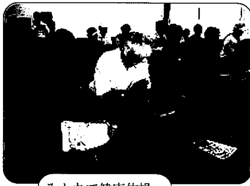
みんなで健康体操

健康寿命を延ばしましょう。身近な場所、気軽に集まれる場所、皆で身体を動かし、健康を維持していきましょう。 健康寿命を延ばしましょう。身近な場所、気軽に集まれる場所、皆で身体を動かし、健康を維持していきましょう。