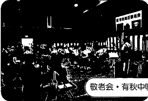
敬老会・有秋中吹奏楽部