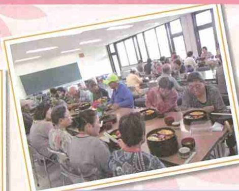
傾聴ボランティア養成講座