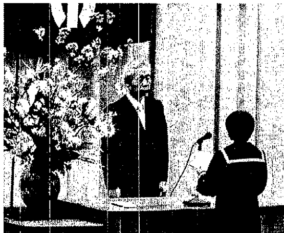
新入生誓いの言葉