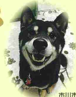
市川市 シンバくん