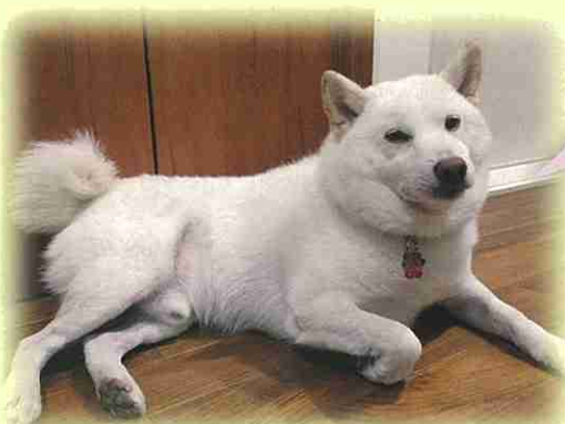
市川市 モンテくん