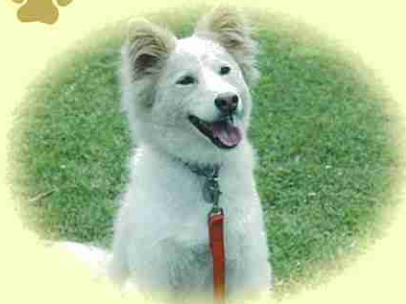
富里市 こはるくん