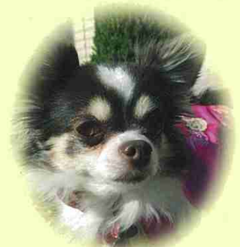
千葉市 チョコちゃん