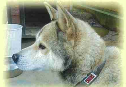
銚子市 サブロウくん