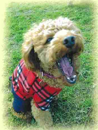
市原市 アメリカちゃん