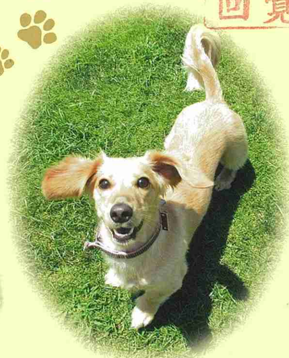
いすみ市 きなちゃん