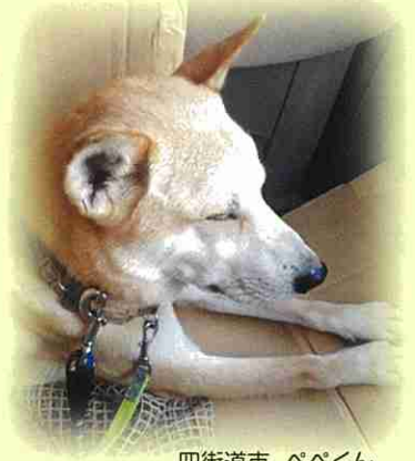
四街道市 ペベくん