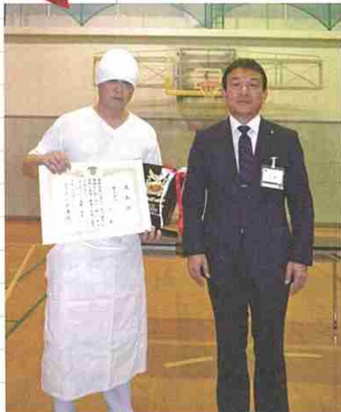
表彰式：平成27年11月8日開催

市原市では、障がい者の雇用促進及び就業の安定を図るため、障がい者雇用に積極的に取り組み、障がい者が働きやすい職場環境に努めている従業員50人未満の事業所を「いちはらスマイルカンパニー」として表彰しています。