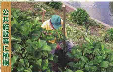
公共施設等に植樹