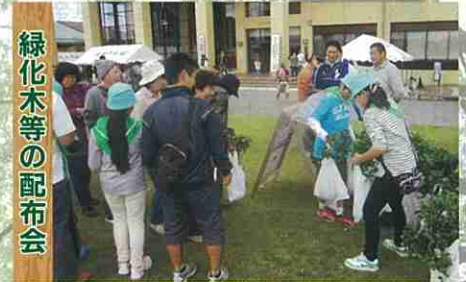
緑化木等の配布会

ボランティアによる森づくりを応援します 県民参加による緑の再生事業・枝打(君津市)