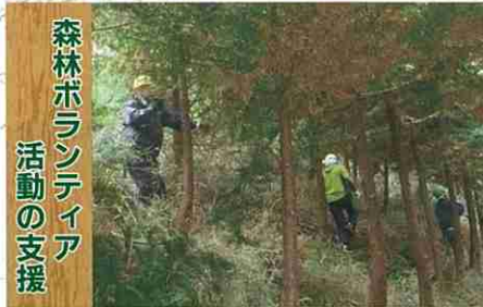
森林ボランティア活動の支援

ボランティアによる森づくりを応援します 県民参加による緑の再生事業・枝打(君津市)