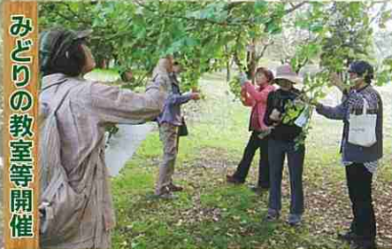
みどりの教室等開催