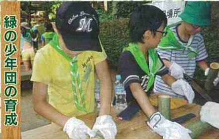
緑の少年団の育成

緑の募金は身近な環境の緑化から、森林の整備、緑の普及啓発事業、森林環境学習など様々な緑化事業に役立っています。(写真はその一例です)