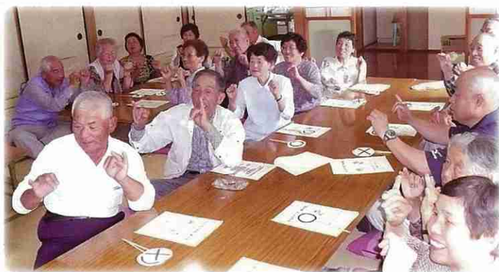
高齢者いきいきサロン／長南町長南地区社協