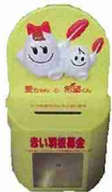
キャラクター募金箱