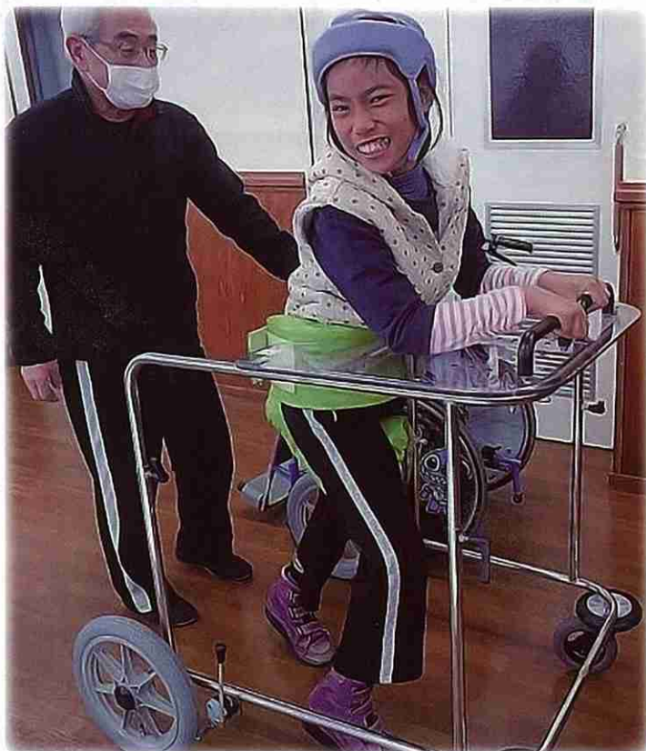
歩行器購入／放課後等デイサービス ひろば (松戸市)