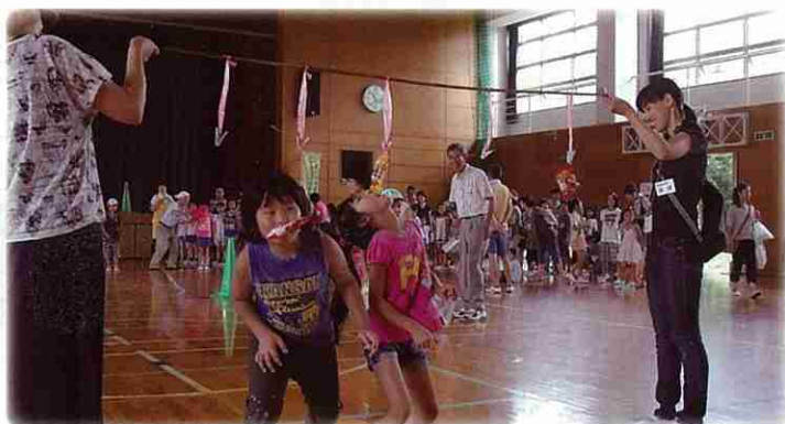
子供ゲーム大会／南山中学校区地区社協 (白井市)

共同募金の助成は、高齢者サロン・子育てサロンの運営や、環境美化活動などのボランティア活動、世代間交流、福祉教育などの事業費用から、障がい者作業所の車の整備・社会福祉施設の改修まで、さまざまな民間社会福祉活動を支援しています。