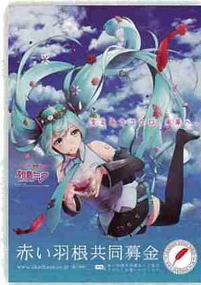
H26 初音ミク ポスター

Illustration by 翠雪 ©Crypton Future Media, INC. www.piapro.net piapro