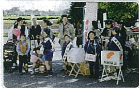
ボーイスカウト富里第一団のみなさん