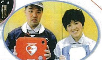
生活介護施設AED設置 / アーアンドデイたいい (成田市)