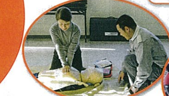
救急救命講習 / 七次中学校区社会福祉協議会 (白井市)