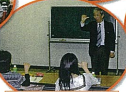
初級手話講習会 / 鎌子市社会福祉協議会