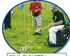
グランド・ゴルフ大会開催 / 千葉県身体障害者福祉協会

*ありがとうメッセージ* 共同募金からの助成により農機具を購入しました。無農薬野菜栽培の効率化がはかれ、又利用者が土に触れる、野菜の成長の喜びを体験しています。これからも農作業の働きがいを求めていきたいです。ありがとうございました。