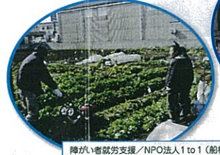
障がい者就労支援 / NPO法人1 to 1 (船橋市)