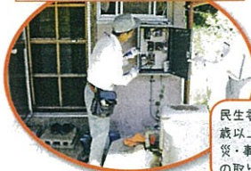
高齢者住宅安心診断 / 東庄町社会福祉協議会

民生委員・児童委員さんの協力のもと、80歳以上のひとり暮らし高齢者希望世帯に防災・事故予防のため、住宅用火災警報装置の取り付けと電気配線診断を行いました。