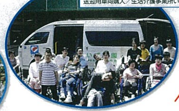
送迎用車両購入 / 生活介護事業所いずみ園 (柏市)