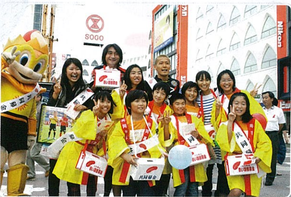
柏レイソルのみなさんと一緒に募金活動 (JR柏駅前:平成22年10月)

平成22年度共同募金に7億3,130万円ご協力いただきありがとうございました。 皆様からお預かりした募金は、あなたのまちの福祉に5億3,299万円を活かさせていただいたほか、福祉施設・団体の整備費や事業費に活用させていただきました。 また、東北関東大震災では、多くの方から義援金をお寄せいただき、ありがとうございます。義援金は県内と全国の被災者へお届けいたします。 さて、平成23年度共同募金については、多くの要望が地域・施設・団体から寄せられ、それを実現するために募金目標額を8億2,000万円といたしました。地域福祉推進のため、皆様のご支援とご協力を賜りますよう、お願い申し上げます。