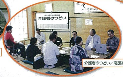
介護者のつどい / 南房総市社会福祉協議会