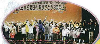
ボランティア団体助成 / むつみおもちゃ図書館(習志野市)