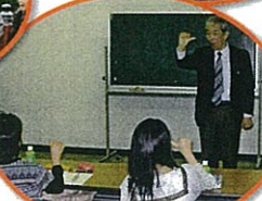
初級手話講習会 / 鎌子市社会福祉協議会