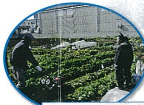
障がい者就労支援 / NPO法人1 to 1 (船橋市)