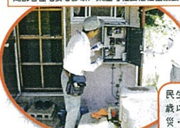
高齢者住宅安心診断 / 東庄町社会福祉協議会

民生委員・児童委員さんの協力のもと、80歳以上のひとり暮らし高齢者希望世帯に防災・事故予防のため、住宅用火災警報装置の取り付けと電気配線診断を行いました。