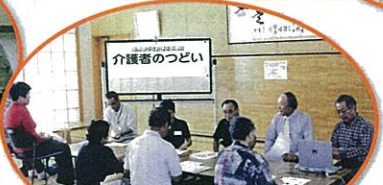
介護者のつどい / 南房総市社会福祉協議会