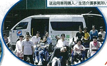
送迎用車両購入 / 生活介護事業所いずみ園(柏市)