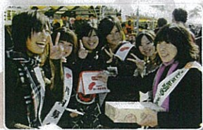
多古高等学校のみなさん