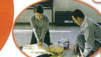
救急救命講習 / 七次台中学校区社会福祉協議会(白井市)

福祉団体・NPOへ (障がい者スポーツ大会、療育旅行・相談など) 23,770,000円 3.1%