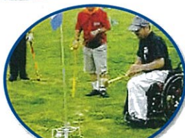
グランド・ゴルフ大会開催 / 千葉県身体障害者福祉協会

共同募金からの助成により農機具を購入しました。無農薬野菜栽培の効率化がはかれ、又利用者が土に触れる、野菜の成長の喜びを体験しています。これからも農作業の働きがいを求めていきたいと思っています。ありがとうございました。