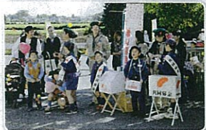
ボーイスカウト富里第一団のみなさん