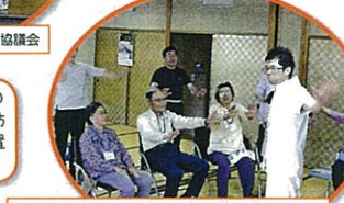
高齢者「和気あいあい」事業 / 長南町社会福祉協議会

民生委員・児童委員さんの協力のもと、80歳以上のひとり暮らし高齢者希望世帯に防災・事故予防のため、住宅用火災警報装置の取り付けと電気配線診断を行いました。