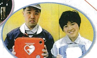
生活介護施設AED設置 / アーアンドデイたいい(成田市)

NHK歳末たすけあい助成 (聴覚利用者の車イステレビなど) 27,096,819円 3.6%