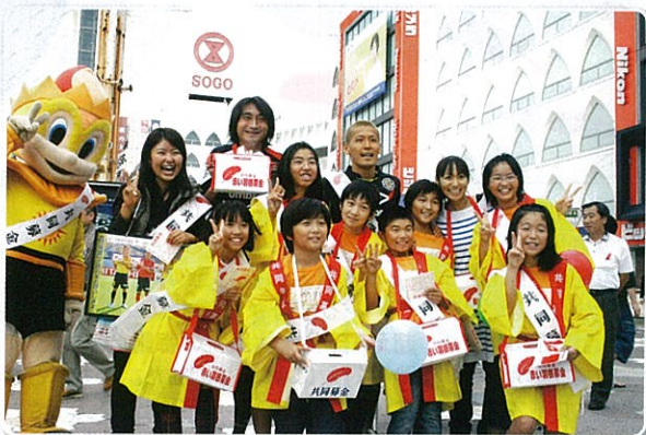
柏レイソルのみなさんと一緒に募金活動 (JR柏駅前:平成22年10月)