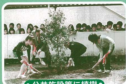
● 公共施設等に植樹 ●

私たちの生活に欠くことのできない貴重な財産がみどりです。森林に代表されるみどりは騒音を防いだり、風害や潮害、土砂崩れなどの災害を防ぐなど安心で潤いある暮らしを支えています。さらにはおいしい水を育み、遠く海の魚たちへもその恵みを分け与えています。特に近年では地球温暖化防止・CO2吸収源として、健全な森づくりへの期待が大きく高まっています。各種緑化・森林整備推進のため、「緑の募金」に本年も皆様一人ひとりの暖かいお気持ちをお寄せいただければ幸いに存じます。