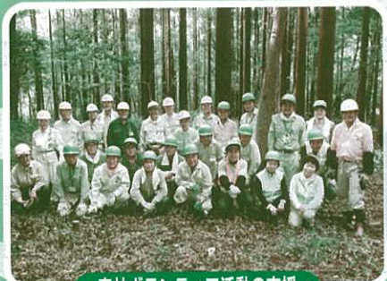
● 森林ボランティア活動の支援 ●