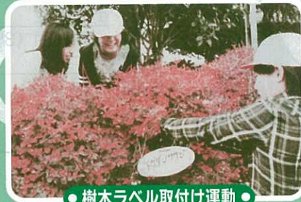
● 樹木ラベル取付け運動 ●