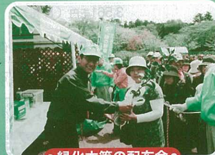
● 緑化木等の配布会 ●

緑の募金は身近な環境の 緑化から、森林の整備、 緑の普及啓発事業、 森林環境学習など様々な 緑化事業に役立っています。