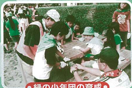
● 緑の少年団の育成 ●