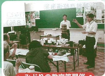
● みどりの教室等開催 ●