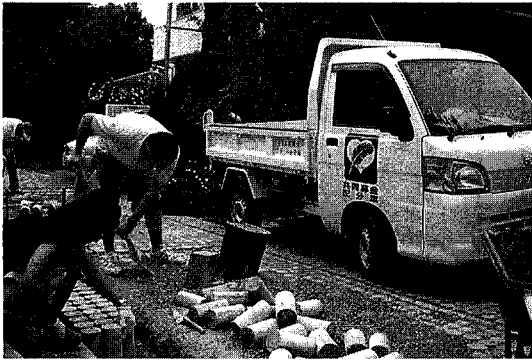
児童養護施設 ひかりの子学園（館山市）