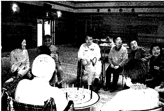
社会福祉法人 成田市社会福祉協議会（成田市）