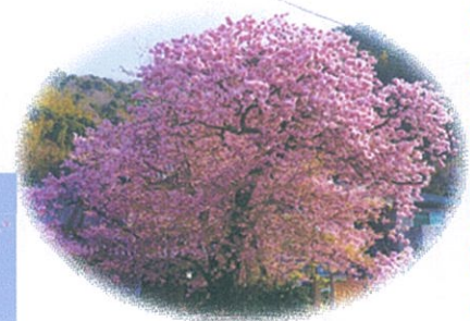
河津桜の原木です